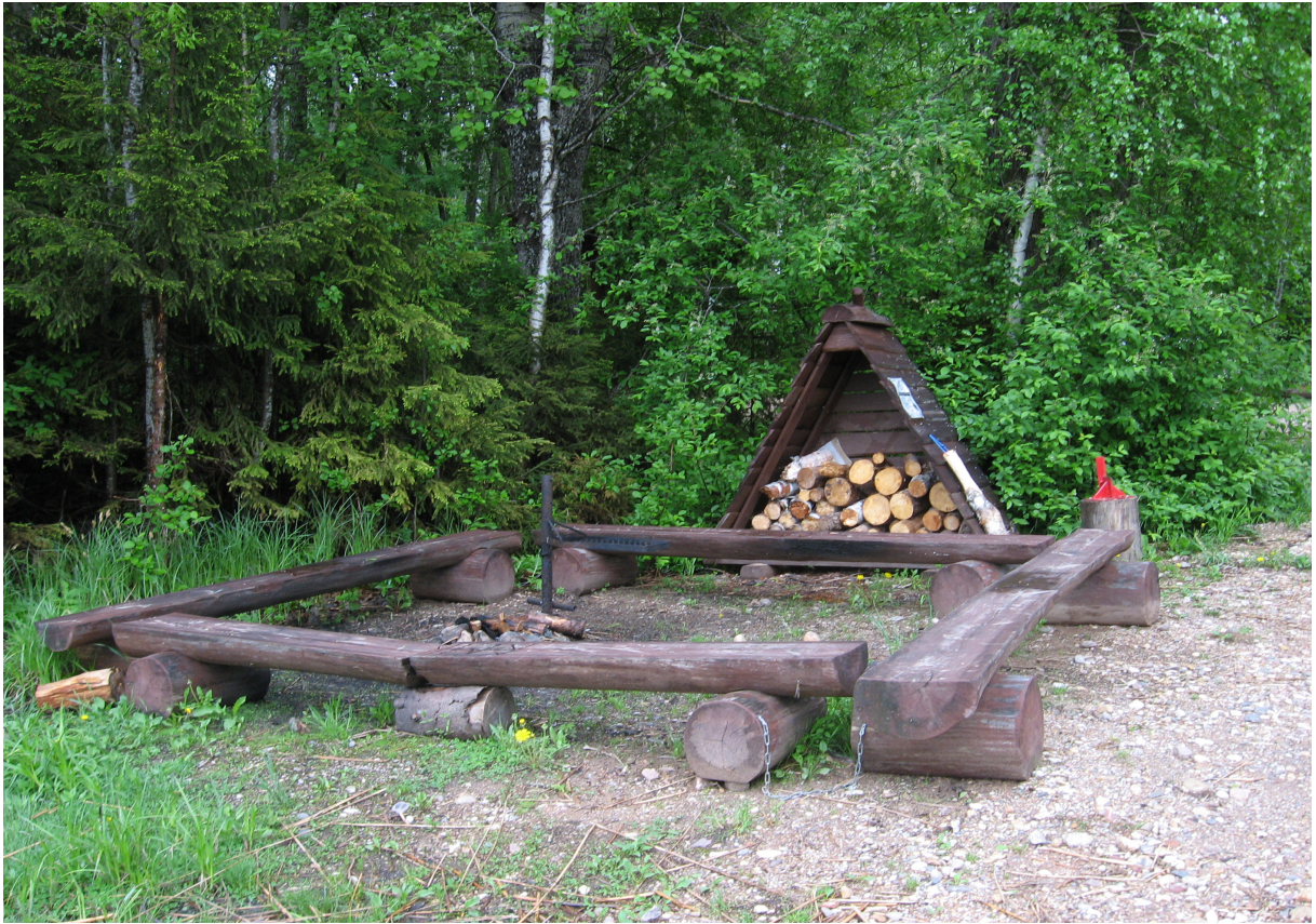
Joonis 3. Lahtine lõkkease Ruhijärve lõkkekohas nr 1.