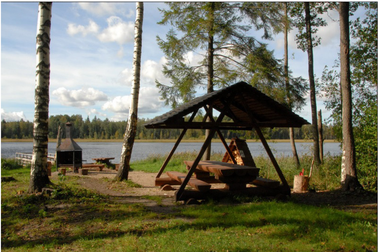
Joonis 4. Ruhijärve lõkkekoht nr 2.