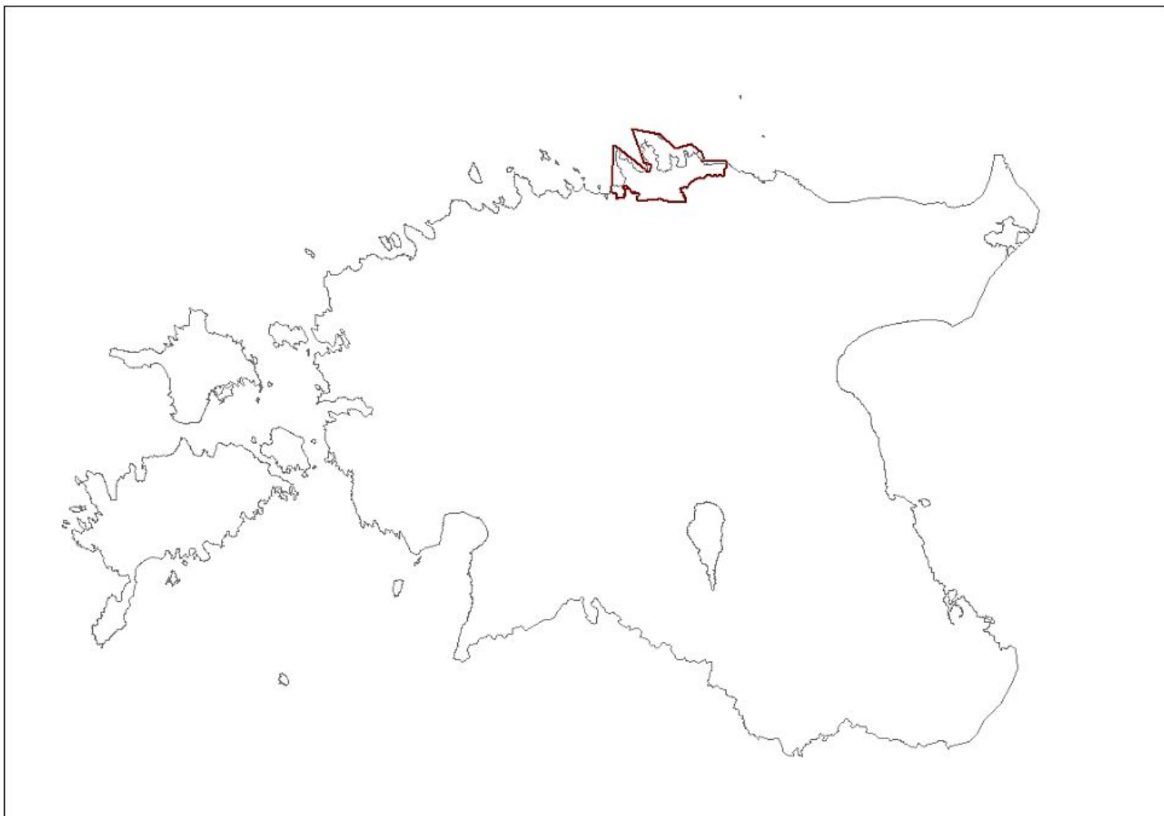
Lisa 2. Lahemaa rahvusparki asukoht Eestis