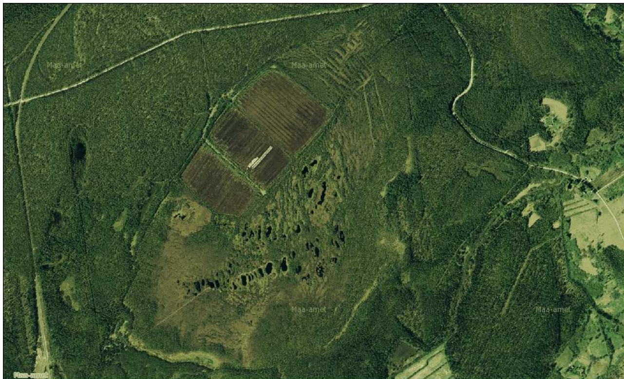
Joonis 1. Viru raba. Raba põhjaosas asuvad endised turbavõtukohad ning loodeosas jätkuvalt taimestumata endised freesturbaväljad. Keskmisel väljakul on heledama laiguna näha turbasambla külvi katselapid. Üle raba kulgeb õpperada.

keskkonnale, märgalade taastamist jms. Pikemas perspektiivis vajab analüüsimist Viru raba servaaladele kaevatud väiksemate kraavide mõju ja sulgemise vajadus. Külastust ja sõidukiga liiklemist reguleeritakse kaitse-eeskirja ning kaitsekorralduskavaga. Selleks, et tingimusi järgitaks, on vajalik teavitust ja järelevalvet.