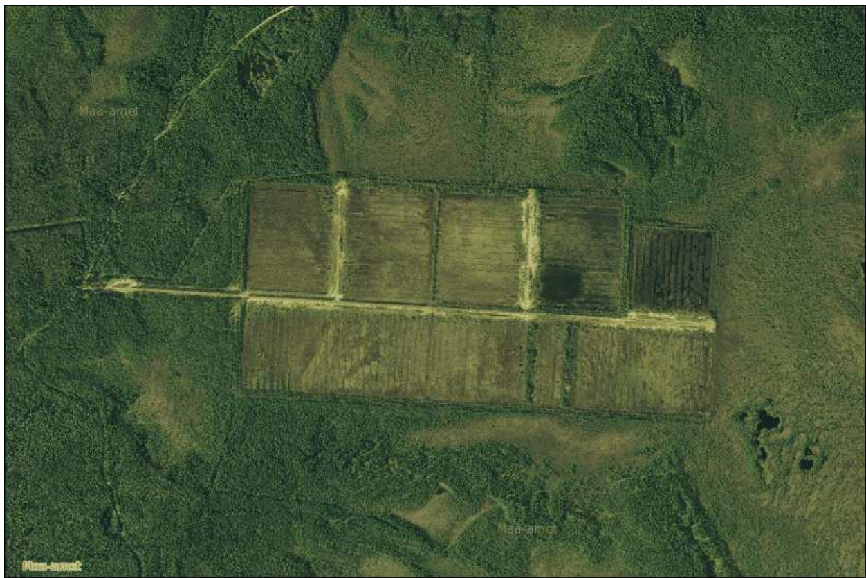
Joonis 2. Hara raba põhjaosas asuv freesturbaväli (, 15.05.2009).