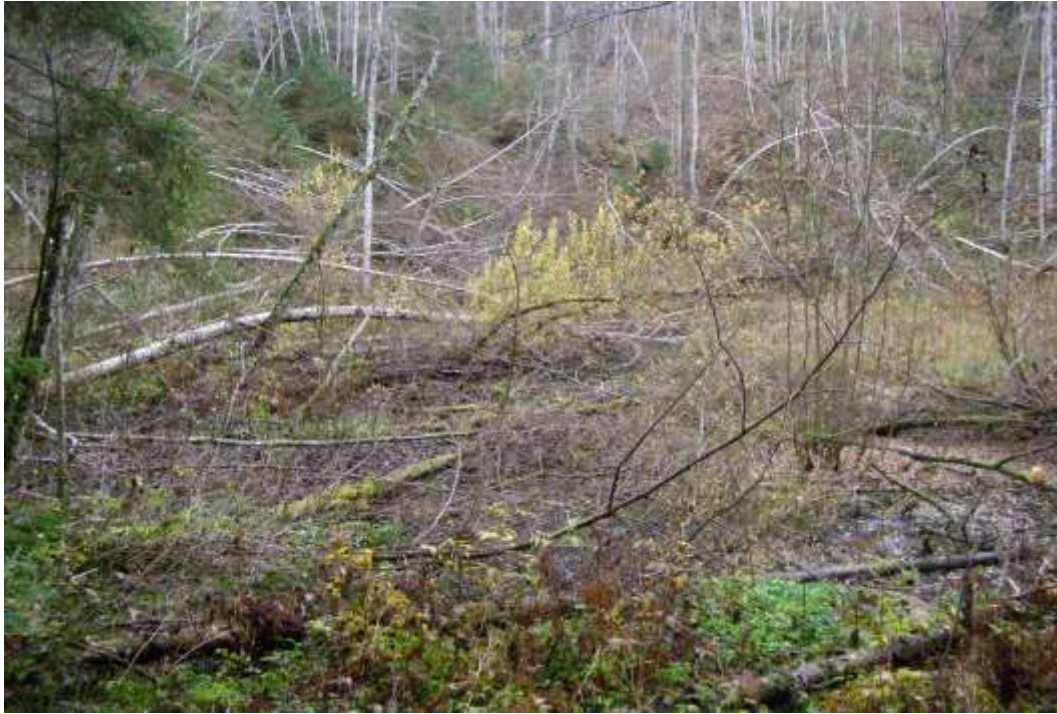
Mahalangenud ja kaardus puud madalsoo servas