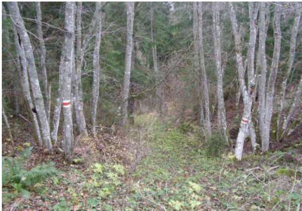
Hooldamist vajav rada kirdepiirilt madalsooni