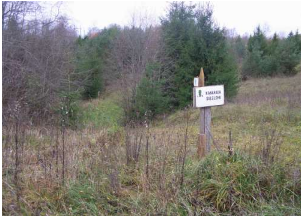
Üksikobjekti tähis kirdepiiril – selle asemele kaitseala infotahvel