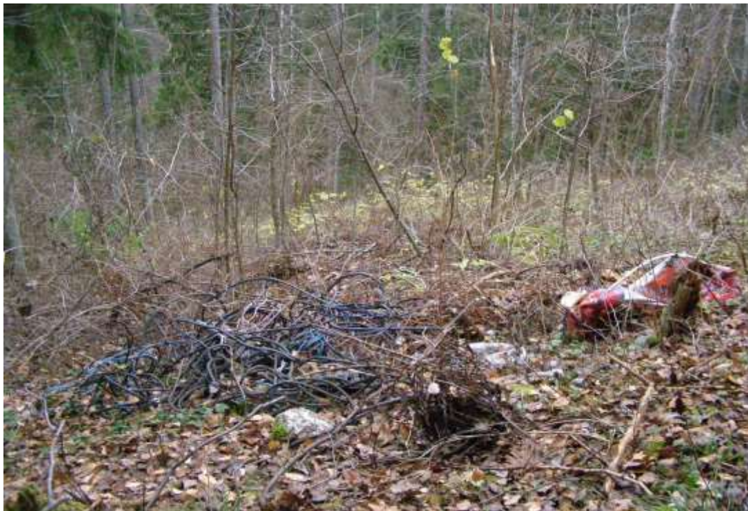
Prügi kaitseala idaservas