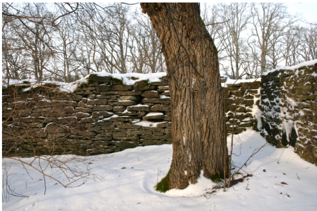
Puu müüri nurgas - regulaarpargi jäänuk?