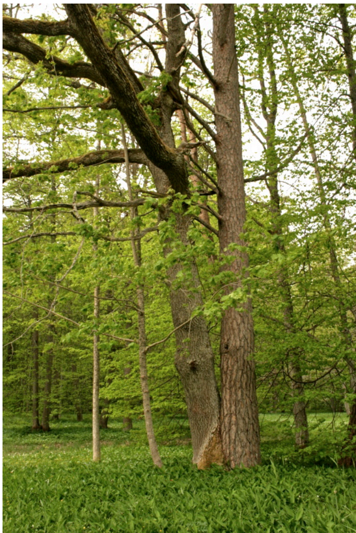
Kokku kasvanud mänd ja tamm