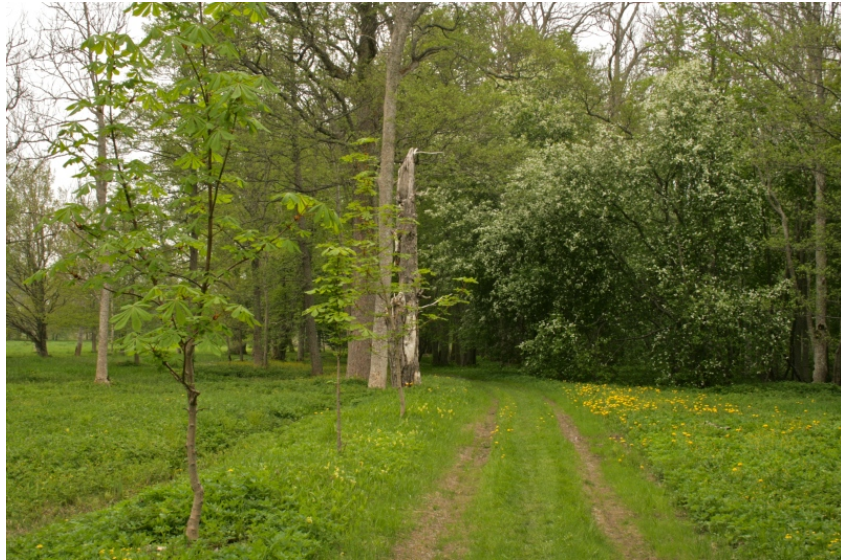
Ala nr 4. Hobukastaniallee (Vaose tee): istutatud noored hobukastanid, suur kraav ja üks männitukkadest