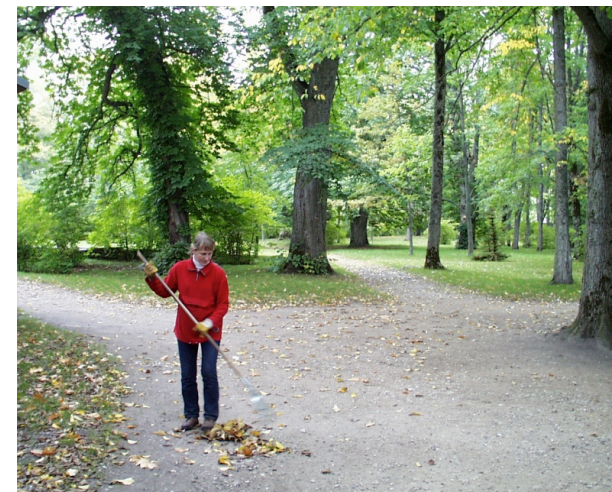
Tagapargi mustad leedrid ja ebajasmiinid