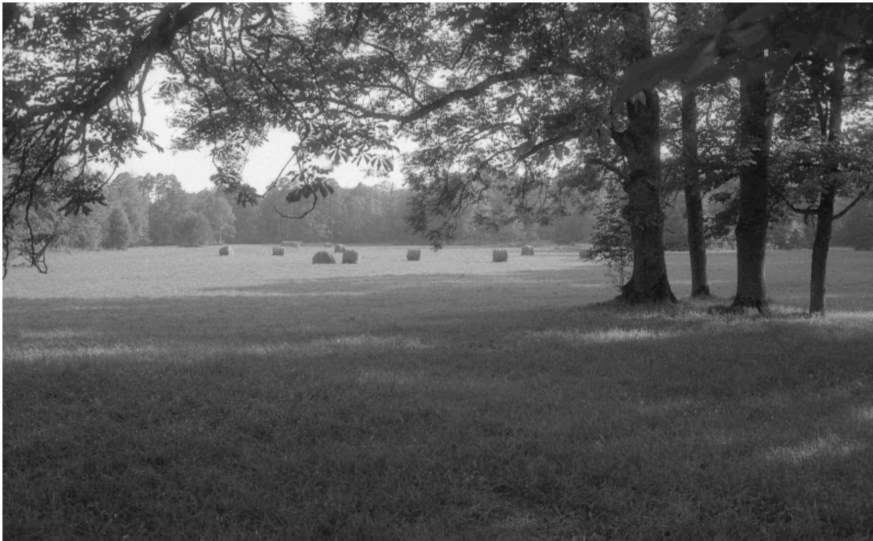
Suur pargiaas 1993. a, niidetud, hein koristatud, esiplaanil kastanid ja saared