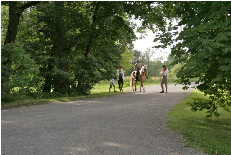
Lossi esised kastanid ja vahtrad